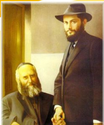
בתמונה: הרבי הריי"צ (יושב) וחתנו רבי מנחם מענדל שניאורסון, לימים הרבי, נשיא דורנו